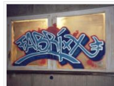
Logo der Serie an einer Wand im alten Fabrixx-Studio

Fabrixx ist eine Jugendfernsehserie, die in dem gleichnamigen Jugendhaus in Stuttgart spielt.