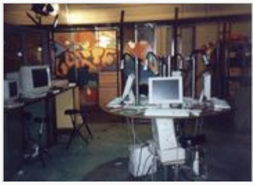
Der "Computerkäfig" im alten Studio

Die Sendung wurde im Auftrag des Südwestrundfunks (SWR), später zusätzlich im Auftrag des Kinderkanals, von Maran Film, der Baden-Badener Tochterfirma der Münchener Bavaria Film, in Stuttgart produziert. Die ersten zwei Staffeln (je 55 Folgen) wurden in einer ehemaligen Fabrikhalle am Stuttgarter Pragsattel (Adresse: Löwentorstraße 68), die letzten zwei Staffeln in der ehemaligen Reitkaserne in Bad Cannstatt (Adresse: Rommelstraße 1) gedreht. Dieser Umzug fand auch in der Serie statt.