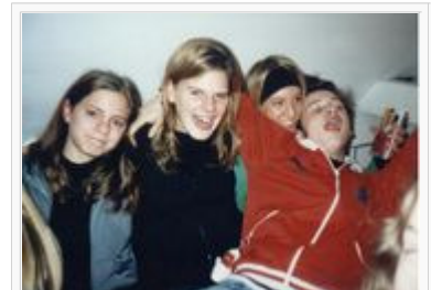
Fabrixx-Darsteller/innen haben Spaß beim Fantag

Die Fanbetreuung durch die Maran Film behielt über die Jahre eine auffällig publikumsfreundliche Qualität. Neben der konstant engagierten Zuwendung zu den Zuschauerinnen und Zuschauern durch die Beantwortung von Anfragen und das Erfüllen von Autogramm Wünschen per Post, das Angebot von Chats mit Darstellerinnen und Darstellern, das Angebotes einer Webcam, auf der ständig